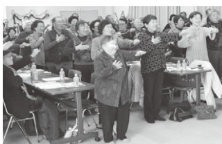
会食交流会 (二人暮らし) 「ふれあい健康教室」