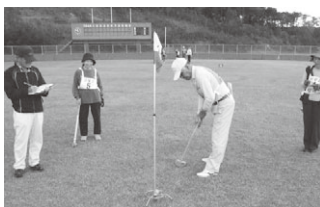
グラウンド・ゴルフ 世代間交流大会