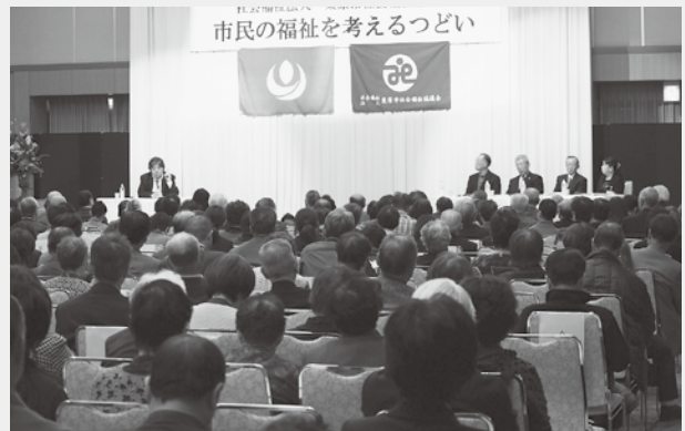
市民の福祉を考えるつどい