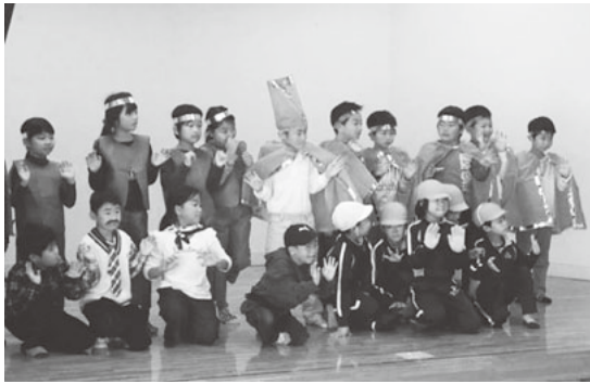
鶯沢小学校、1年生・2年生の皆さん

11月15日(火)、民生委員の皆さんにご協力いただき、日中一人暮らし高齢者の方々を招いて、鶯沢小学校の児童による踊りや劇を楽しむ交流会を開催しました。元気いっぱいに演じる子どもたちに、高齢者の皆さんは笑顔で拍手や声援を送っていました。