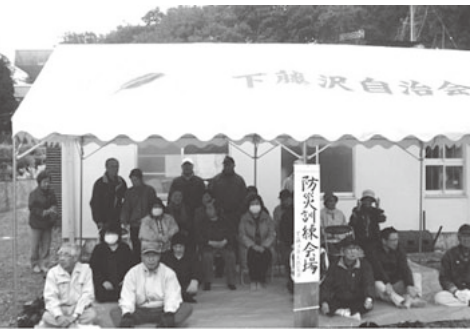
2次避難所に、避難完了しました!