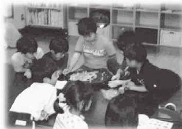
野球盤ゲームに大盛り上がり