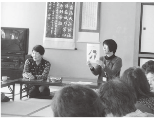
仲間外れは、どれ？ いろいろ考えられますね

2月25日(木)、北郷公民館を会場に包括支援センターより講師を招き、認知症予防の取り組みや脳トレの実践を行いました。その後は、スマイルボウリングを楽しみました。参加者20名笑顔いっぱいの日を過ごしました。