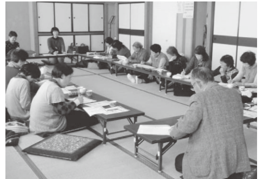
日頃からの取り組みが大事です。