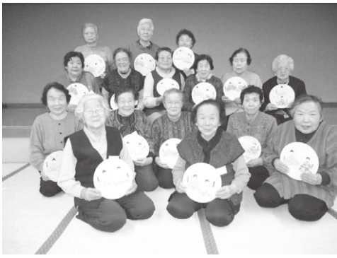
あかりをつけましょ ぼんぼりに～♪ ひな飾りを作成しました。