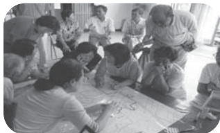
【まっぷ作成】調査した内容を地図に書き込み。