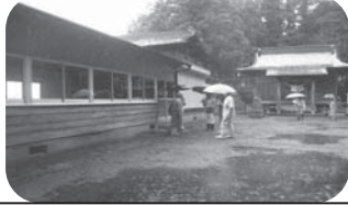
【現地踏査】行政区内を歩いて調査。