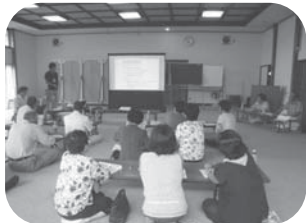
【事業説明】なぜ「防災まっぷ」を作るのか。

7月10日(木)、台風接近であいにくの天候の中、新田地区が防災まっぷ作成事業に取り組みました。自分たちの目で、自分たちの住む地域を知り、「防災まっぷ」を作成していれば、いざという時でも安心です。