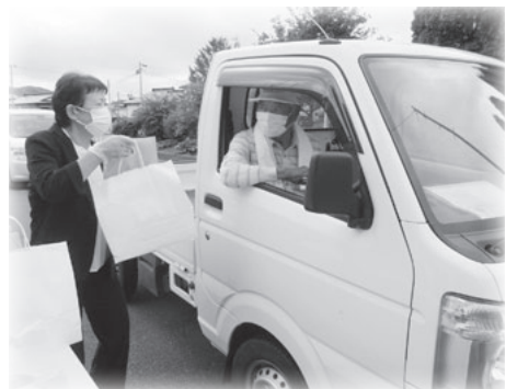
いつまでもお元気で!!