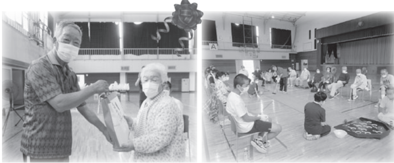
3年ぶりの交流に大いに盛り上がりました!