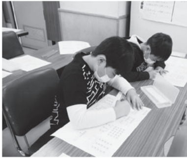
【点字体験】四苦八苦しながら点字を打っています。