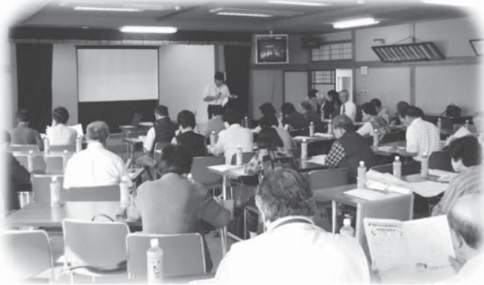
鶯沢老人福祉センターにて共同募金奉仕委員会議の様子