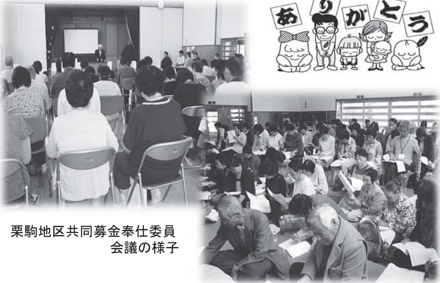
栗駒地区共同募金奉仕委員 会議の様子

また、市内各所で、街頭募金を実施しております。見かけられたときには、ご協力をよろしくお願ひします。