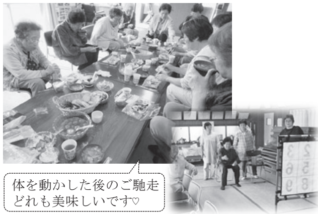
体を動かした後のご馳走どれも美味しいです♡

上荒町地区のボランテイア等が主体となり、隔月でお茶つこ会を実施しています。毎回、輪投げやボウリングなどで体を動かし、わいわい行っています。昼食は、テーブルに並んだご馳走を前に、「これ、何の佃煮だかわかる?当ててみて」など会話が弾み、和気あいあいと楽しい時間を過ごしています。