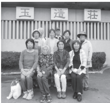
これからもボランテニア、楽しんで続けていきましょうね。

温泉に入り、日頃の活動を互いにねぎらうことで、今後につながる活力を得ることができ、有意義な移動交流会となりました。