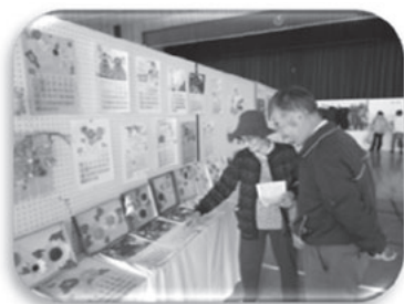
生きがい活動支援通所事業の皆さんの作品

お茶っこコーナーでは、文化祭に来場された皆さんの交流の場として、楽しんで頂きました。また、瀬峰デイサービスセンターや生きがい活動支援通所事業の皆さんの素敵な作品が会場いっぱいに表示されました。