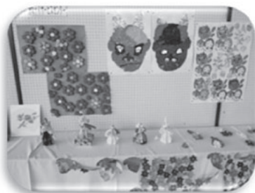
瀬峰デイサービスの皆さんの作品