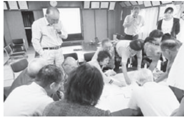
上荒町・下荒町地区