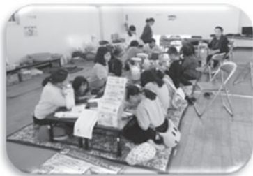
プラバン作りも行いました。大人の方にも大好評でした。☆