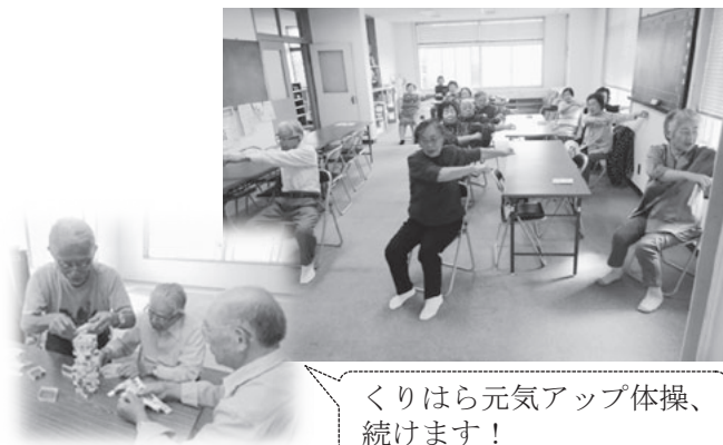
くりはら元気アップ体操、続けます!

地区社協主催のお茶つこ会は年に4回実施しており、お茶つこ会の他にも、健康づくり事業や介護予防事業に取り組んでいます。皆さん、続々と歩いて集会所に集まり、毎回「くりはら元気アップ体操」から始まります。互いに励まし合い継続することで、互助の関係ができています。