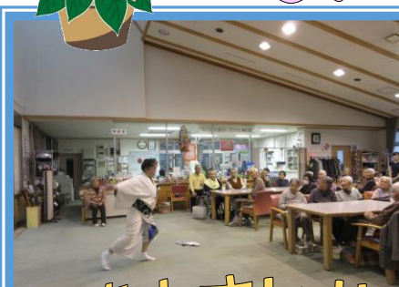
高清水すいせん会