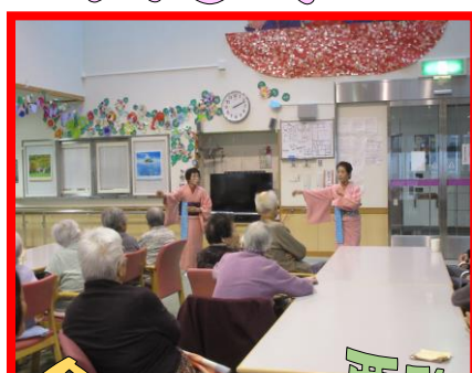
栗駒レクダンス愛好会