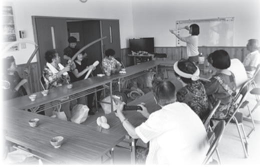
バルーンアートは 世代を問わず楽しめます♪