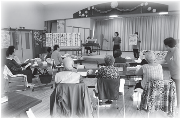
「ピアノに合わせて一緒に歌いましょう」