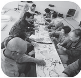
おしゃべりしながら楽しく貼り絵を作っています♪