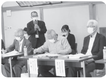
奉仕委員会議の様子