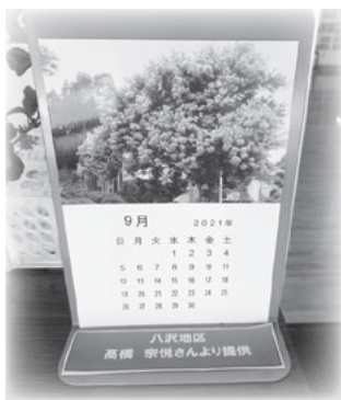
9月はサルスベリの花