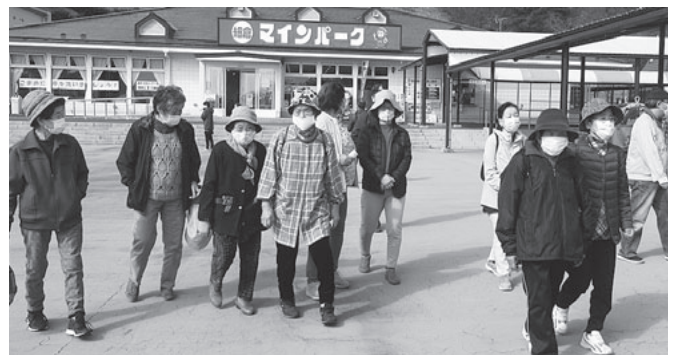
みんなと会えてよかったわ!