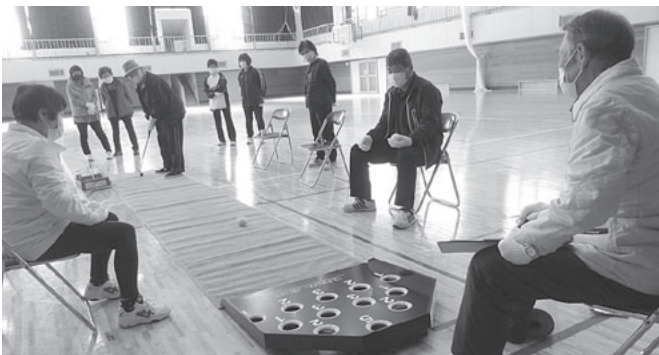
娘とひ孫に誘われて参加しました♪