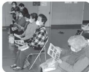
『活動の様子を写真で振り返りました♪』