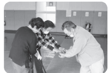
『一年間使用したスカットボール。感謝をこめて丁寧に磨きます♪』

月に一度金成公民館に集まり、スカットボールで体力維持を図っています。この日は、年間優勝者を表彰し1年間のプレーをお互いに称えました。仲間と過ごすかけがえのない時間が、一番の健康の秘訣ですね♪