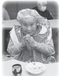
ご家族手作りの ちゃんちゃんこ!