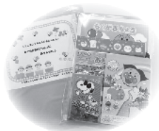
中身はアンパンマン のぬり絵セットです

例年、栗原市社会福 祉協議会栗駒支部で開 催していた「栗原で育 てよう！ちびっこ育成 ミニ運動会」が新型コロ ナウイルス感染症の拡 大のため中止すること となり、令和2年度は 園児の皆さんへ記念品 を贈呈をいたしました。