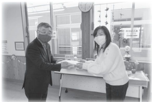
園長先生に代表してプレゼントを受け取っていただきました。