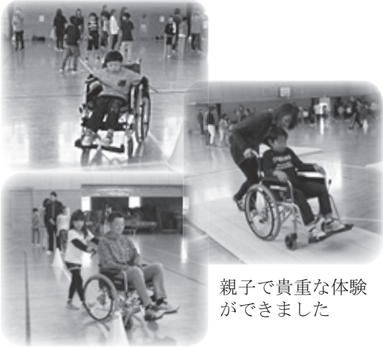
親子で貴重な体験ができました

白杖体験では、目隠しをして視覚障がい者の視点に立ち、障害物があるとところなどを歩き、介助する側とされる側の体験を行い、視覚に障がいのある方の「不便さ」を学びました。