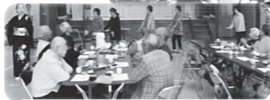
ボランティアさんと一緒に踊りました(*^_^*)