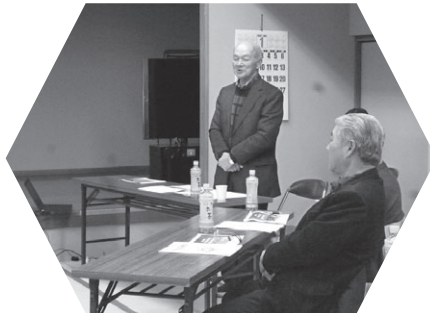
「年末おたすけ隊事業」は安否確認の一環として行っています。